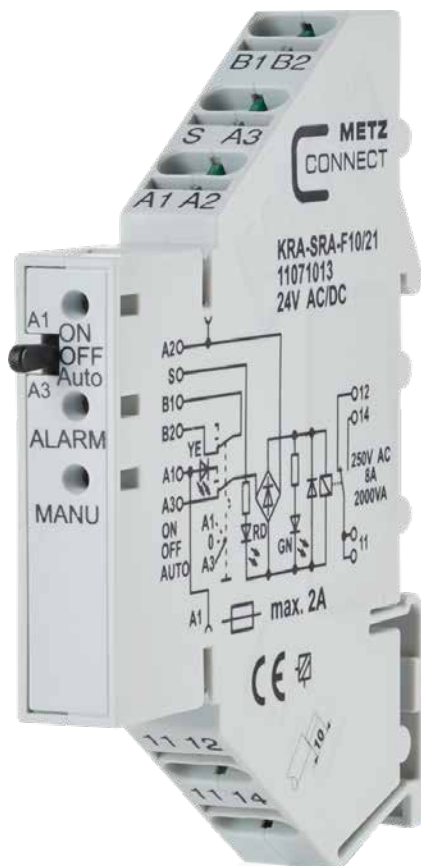
Relais de couplage KRA-F

créer une connexion entre l'unité de commande et la charge